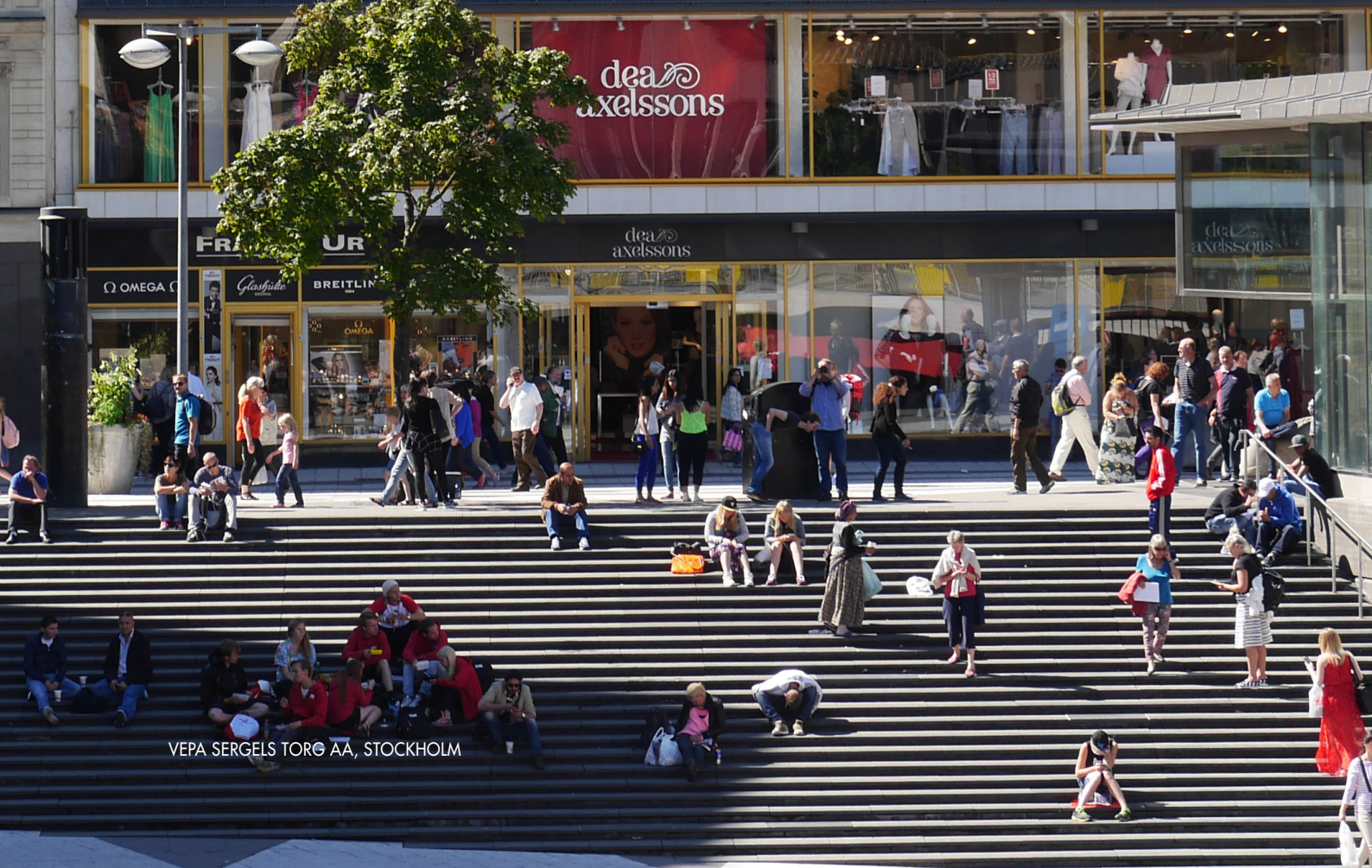
VEPA SERGELS TORG AA, STOCKHOLM